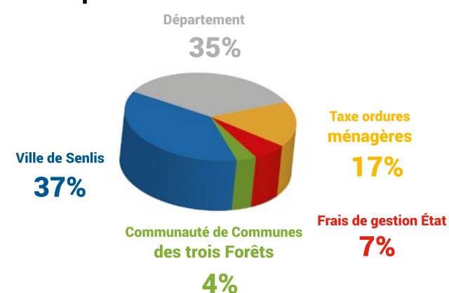
Répartition taxe foncière 2015