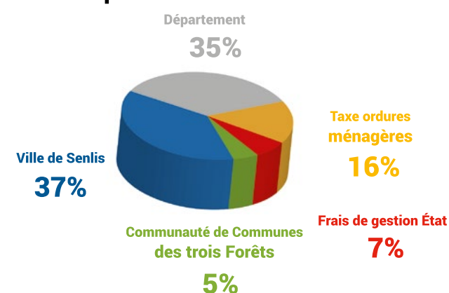
Répartition taxe foncière 2016